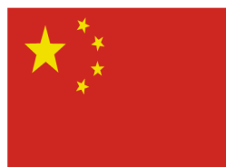
AI ER FRA KINA