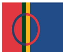
NIILAS ER SAMISK