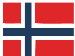
LISE ER FRA NORGE